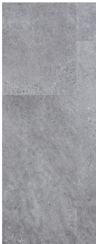
Graft Flise Varenr.: 155051 DB nr.: 1968011