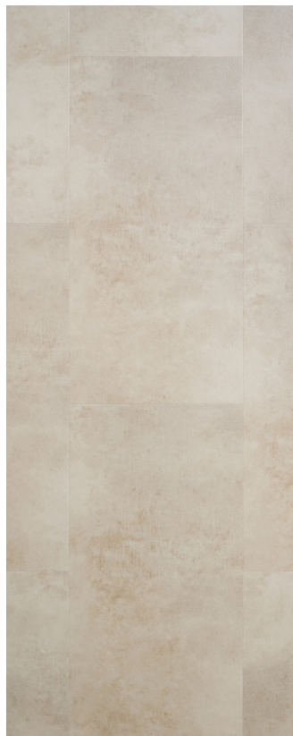
Ceramica Flise Varenr.: 155059 DB nr.: 2391838