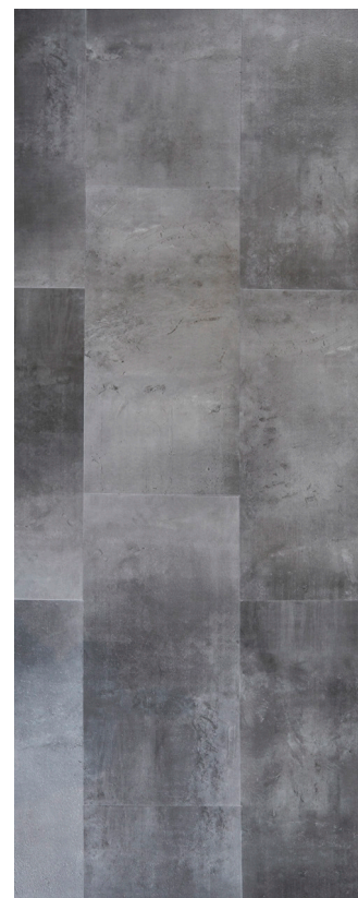
Antracit Flise Varenr.: 155052 DB nr.: 1968012